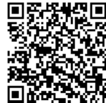
QR-Code zum Produkt